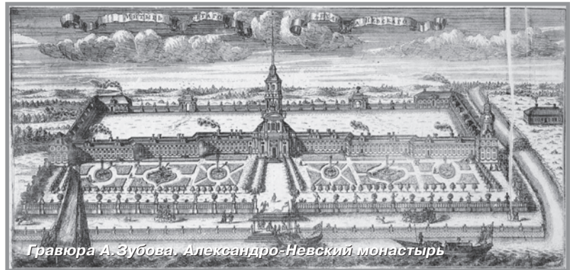
Гравюра А. Зубова. Александро-Невский монастырь