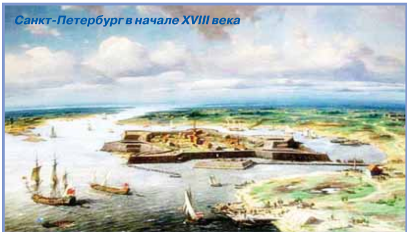
Санкт-Петербург в начале XVIII века