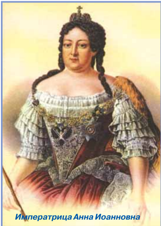
Императрица Анна Иоанновна

«...Те церковные служители, которые присягали в 1730 году в верной службе Ее Императорскому Величеству, но при этом, имея детей своих, кои были тогда не более семи лет от рождения, к присяге их не послали, то таких церковных служителей к тому и не понуждали. Следствие умысла и противности в том не видело. Дети в это время слишком малы и в присяге мало смыслят, что она есть и зачем. Обеща-