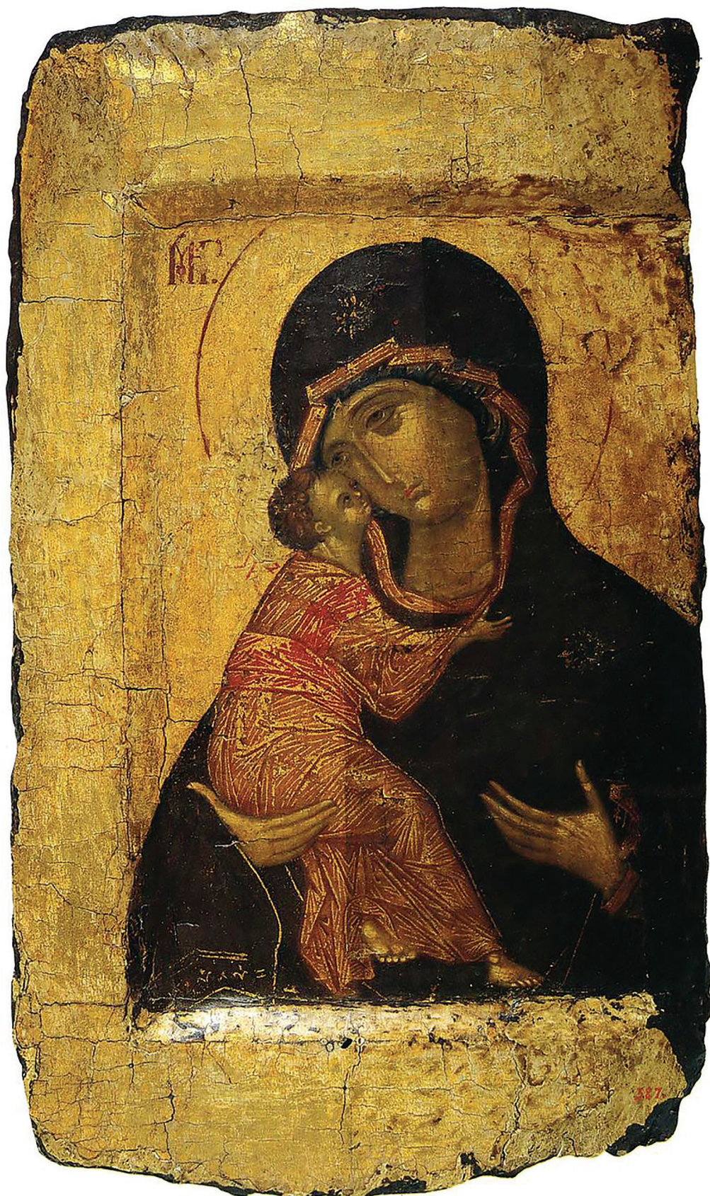
Икона Богоматери Владимирской «Умиление». Первая треть XV века Государственный Русский музей

Созерцание погруженной в раздумья Богородицы ведет к состоянию самосозерцания. И все в художественном замысле иконы подчинено этому внутреннему движению. Ее глубокий ковчег и текучий плавный силуэт темного мафория создают то сакральное пространство, в которое помешены фигура Христа и необычно сложенные, подчеркнута маленькие и хрупкие руки Богородицы. Полукруглая линия Ее левой ладони с вытянутым и отогнутым большим пальцем уподоблена форме священной чаши, диска, на который возложено Тело Младенца Христа. Его царственные златотканые одежды, препоясанные кинорварной перевязью, напоминают об Искуплении. Но идея страдания и жертвоприношения Сына понята здесь как величайшее Материнское милосердие, высочайшая степень Любви Богородицы-Церкви к миру. Как Святое Причастие, возложенное на чашу, передает Богородица людям Сына, причащая их «Божественному естеству», «соединяя и срастворяя их с Любовию Божией» (Иоанн Лествичник). Поэтому столь необычно положение левой кисти Марии, опущенной на один уровень с Ее правой ру-