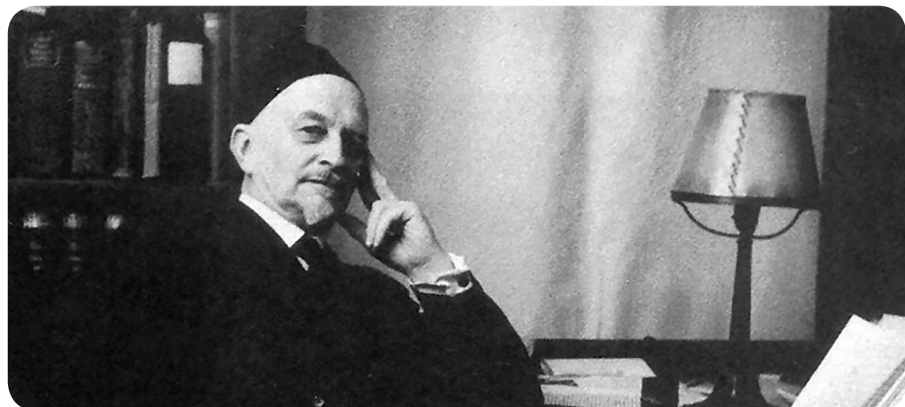
И.А. Ильин за работой. 1951 г.

Православное понимание педагогического процесса и особое значение патриотической деятельности в деле воспитания наиболее четко представлено в трудах русского философа И. А. Ильина (1883 - 1954). И. А. Ильин – русский религиозный философ – является одним из наиболее ярких мыслителей-эмигрантов «первой волны». Ильиным сочинена педагогическая система воспитания и развития личности, основанная на сочетании морально-нравственных установок православия с гуманистическими национальными ценностями. Русским философом предложен путь выхода из духовного и религиозного кризиса, охватившего человечество в нач. XX в., - путь духовного обновления на уровне отдельной личности и общества в целом. Выдвинутая Ильиным концепция воспитания «духовно-зрячего» человека, ориентированного на вечные основы духовного бытия, востребована и поныне. Ильин рассматривал педагогический процесс особой частью общего социального процесса, обладающей собственными закономерностями. Главными слагаемыми педагогического процесса являются семья, школа и церковь. Поэтому задачи семьи, школы и Церкви он не отделяет и от проблем общественно-культурного развития.