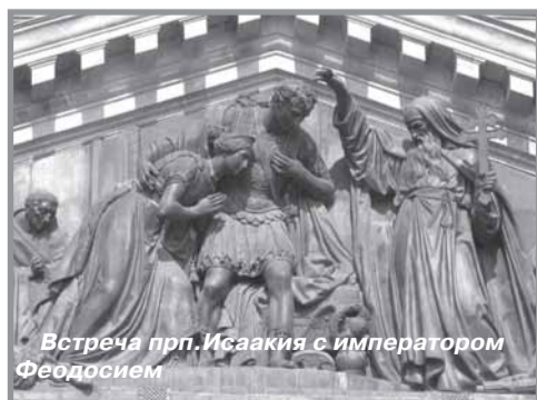
Встреча прп. Исаакия с императором Феодосием

Самой опасной работой являлось золочение куполов. Золочение главного купола, колоколен и крестов велось с 1835 по 1843 гг. Редким, ни разу больше в архитектуре не применявшимся способом. Это самый прочный — огневой — способ. Листы меди покрывались жидкой смесью золота и ртути, медленно прогревая листы над жаровнями, ртуть выпаривали. Золочение было трех-