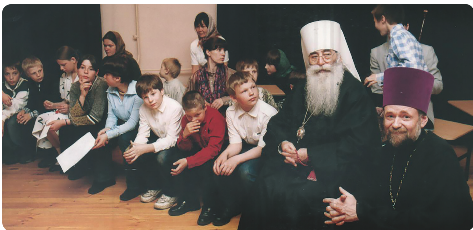
Приют, опекаемый братством св. Анастасии Узорешительницы

Возрождена монашеская жизнь в Александро-