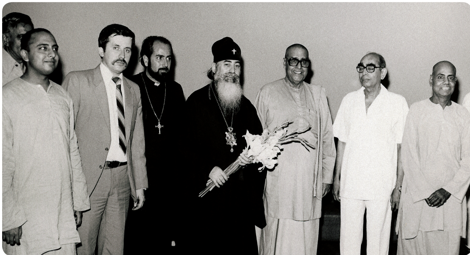
В течение последующего служения правящим архиереем владыка принимал участие в миротворческой и экуменической деятельности, побывав во многих странах мира

Лавры. В том же году Епархиальное управление въехало в Митрополичий корпус Лавры. Начался ремонт его помещений, продолжавшийся долгие годы. Реставрировался и весь лаврский комплекс.