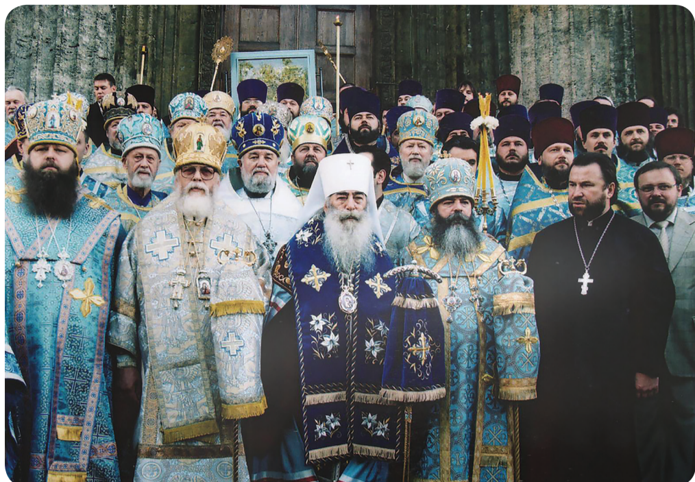
Историческим событием стало возвращение в 2004 году из США в Тихвинский монастырь Тихвинской чудотворной иконы Божией Матери