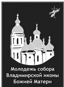
Молодежь собора Владимирской иконы Божией Матери