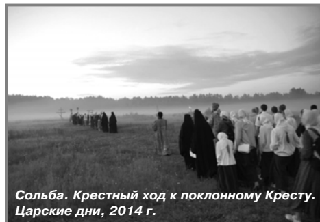
Сольба. Крестный ход к поклонному Кресту. Царские дни, 2014 г.