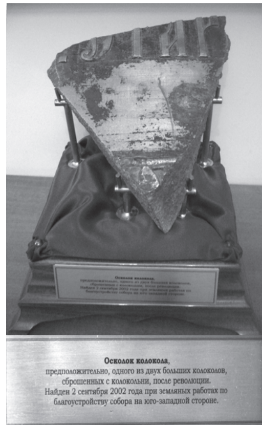
Осколок колокола, предположительно, одного из двух больших колоколов, сброшенных с колокольни, после революции. Найден 2 сентября 2002 года при земляных работах по благоустройству собора на юго-западной стороне.

Хотя у нас по Колокольной улице ходят трамваи, а улица узкая, пути и вагоны были тогда старые, грохот стоял неимоверный. Помню, как мне пришлось принимать работу на куполе колокольни, мы тогда золотили на ней крест, это было мое первое восхождение на такую высоту — 68 метров у нас колокольня. Снизу кажется, что луковица креста, сам крест — маленькие, на самом деле они огромные. И вот, когда я поднялся туда, вдруг колокольные леса затряслись подо мной как осиновый лист. Я вцепился в леса, спрашиваю: «Что такое?» — «Да, трамвай проехал», — ответили мне позолотчики — «Леса-то не развалятся?» — «Да нет...»