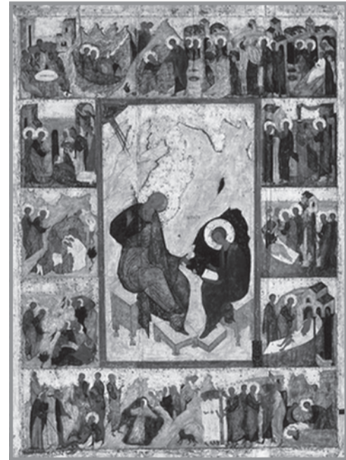
Иоанн Богослов записывает Откровение Иисуса Христа

Уместно здесь вспомнить и положение, сформулированное в Основных социальных концепциях Русской Православной Церкви по отношению к глобализации (фрагментом которой является тотальный контроль всех и вся): «В целом вызов глобализации требует от современного общества достойного ответа, основанного на заботе о сохранении мирной и достойной жизни для всех людей в сочетании со стремлением к их духовному совершенству. Помимо сего, необходимо достичь такого мироустройства, которое строилось бы на началах справедливости и равенства людей перед Богом, исключало бы подавление их воли нацио-